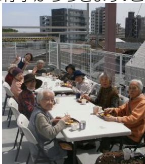
爽やかな天気～ 屋上でランチタイム